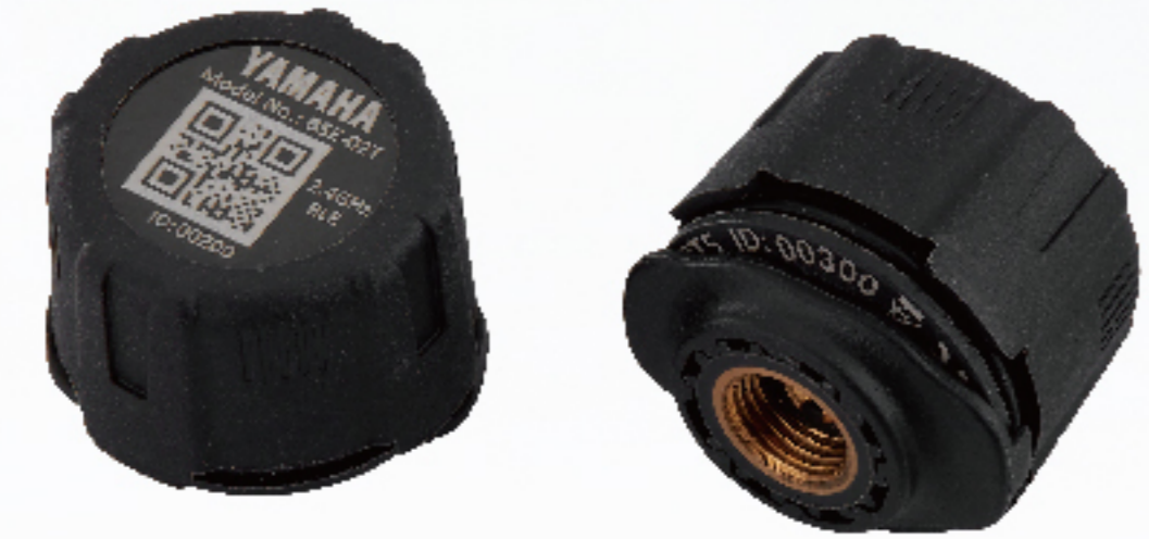
藍牙胎壓偵測器 | $2,100 BLC-QF5AW-00