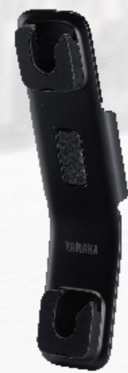
多功能支架 | $1,800 BFV-QF837-00