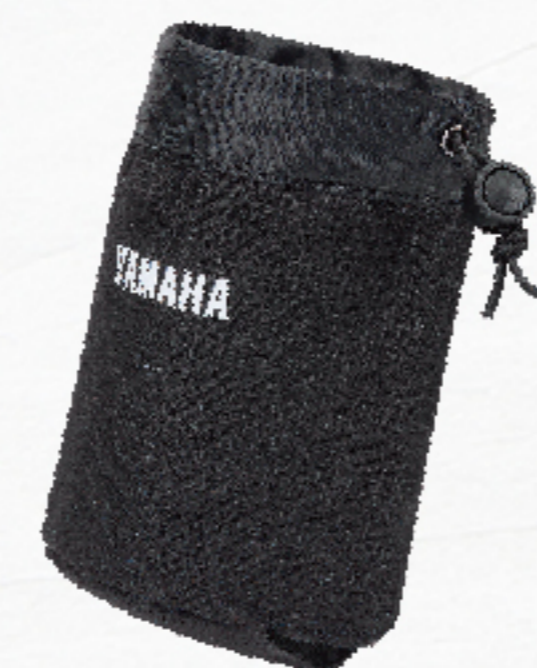
多功能支架配件 | $500 BFV-QFBAG-00 輕便杯袋