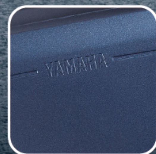
電弧藍 (深藍深灰) E09AC1