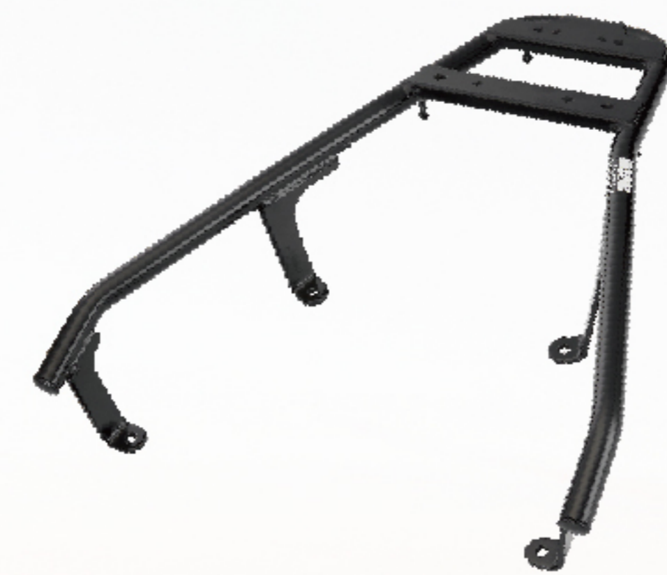
後架 | $4,500 90798-1Y985