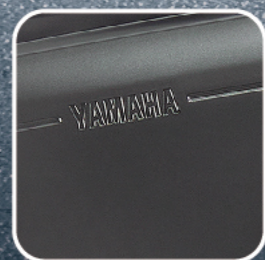
星辰鈦 (灰) E09541