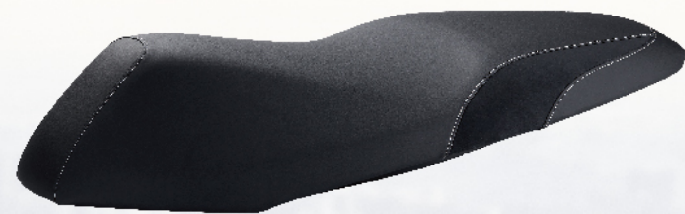
低座高坐墊 | $1,900 BFV-QF470-00