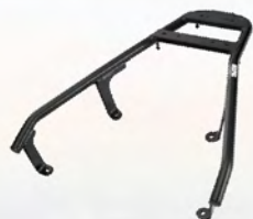
後架 | $4,500 90798-1Y985