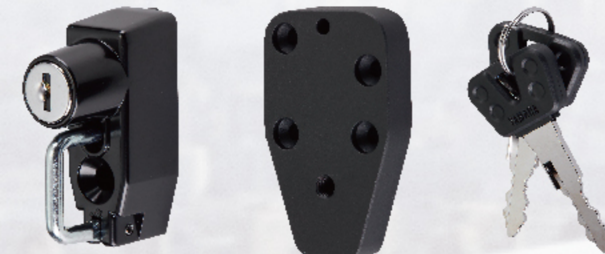
多功能支架配件 | $500 BFV-QF83B-00 安全帽鎖