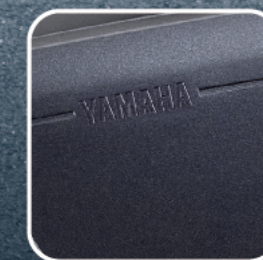
闇馳黑 (深藍) E09441