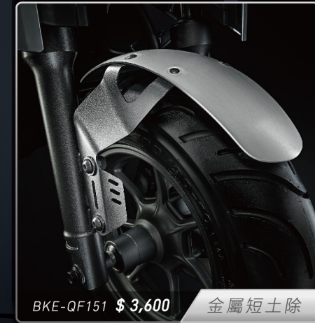
BKE-QF151 $ 3,600 金屬短土除