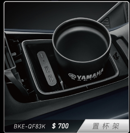
BKE-QF83K $ 700 置杯架