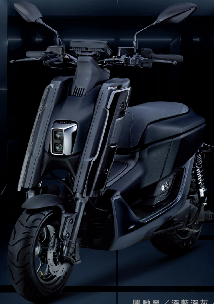
間馳黑 / 深藍深灰 / G06AC1