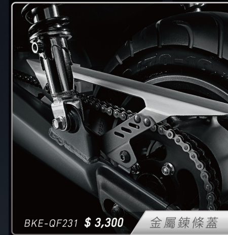
BKE-QF231 $ 3,300 金屬鍊條蓋