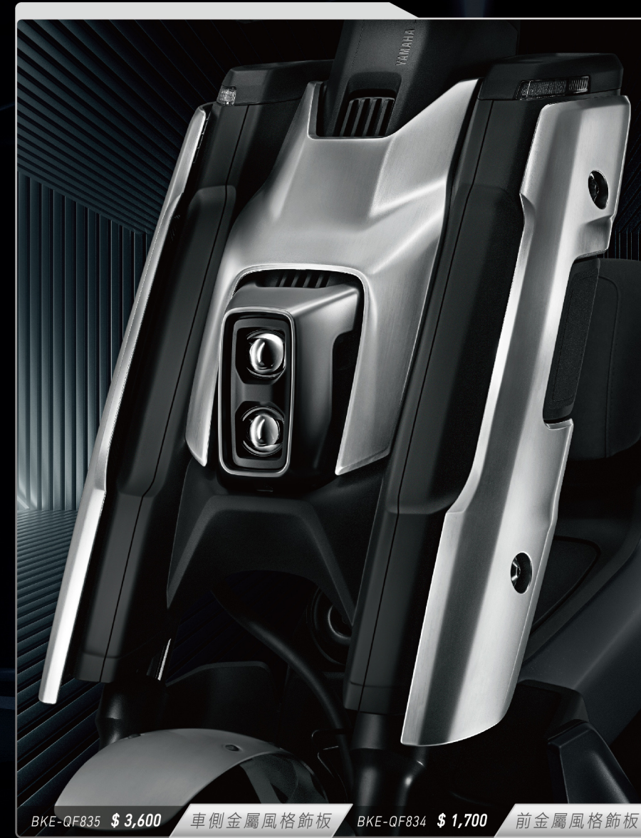
BKE-QF835 $ 3,600 車側金屬風格飾板 BKE-QF834 $ 1,700 前金屬風格飾板