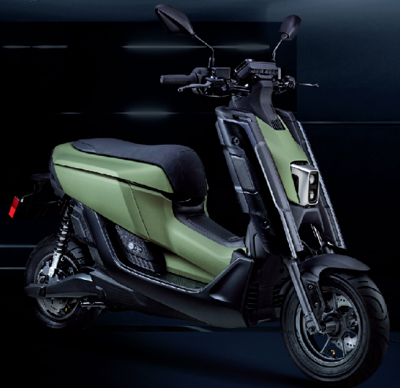
蒼遠綠 / 綠深灰 / G06AR1