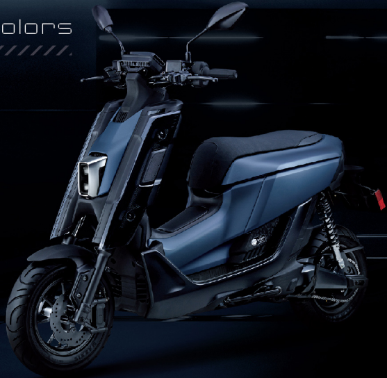
寂光藍 / 藍深灰 / G06BQ1