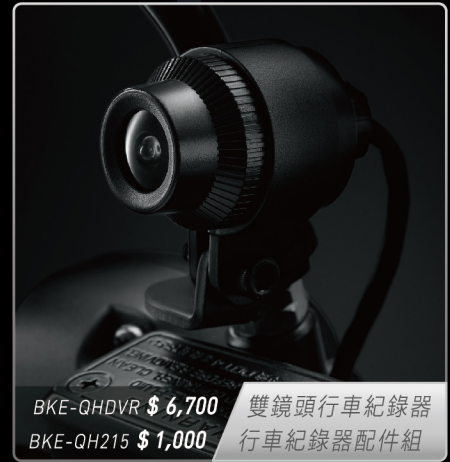
BKE-QHDVR $ 6,700 雙鏡頭行車紀錄器 BKE-QH215 $ 1,000 行車紀錄器配件組

價格皆為建議售價，未包含安裝工資，商品以實物為主，本目錄僅供參考，YAMAHA 保留變更之權利，欲了解更多商品詳情，請掃描 QR CODE 至 YAMAHA 官網查詢