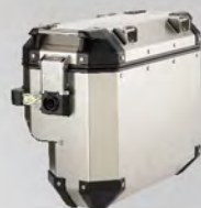
鋁側箱(右)37L | NT$.16,500