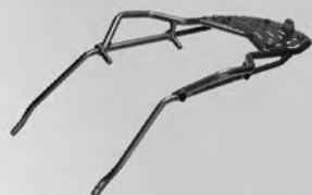
後架總成 | NT$.10,500