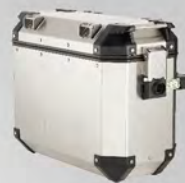
鋁側箱(左)35L | NT$.16,500