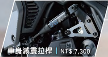
車身減震拉桿 | NT$.7,300