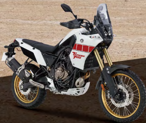
Classic White 白紅 176121