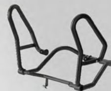
引擎保桿 | NT$.10,000