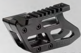
導鏈器 | NT$.31,000