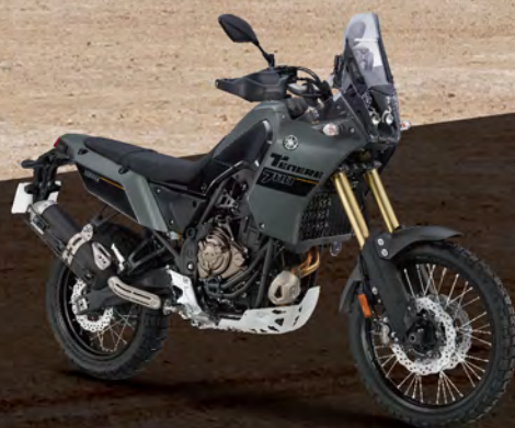
Tech Kamo 深灰 176451