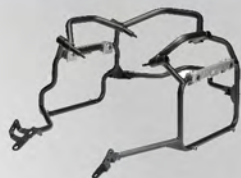
鋁側箱支架 | NT$.13,500