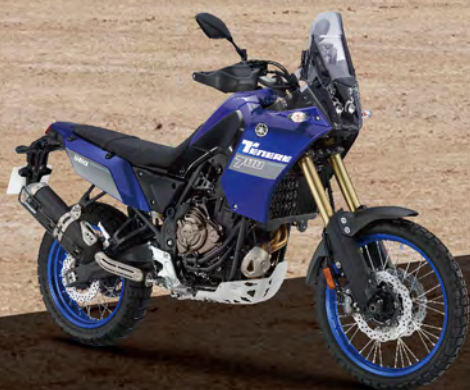
Icon Blue 藍深灰 176BQ2