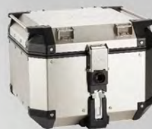
鋁後箱42L | NT$.16,000