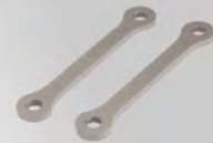
降座高套件 | NT$.3,900