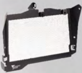
水箱護網 | NT$.4,700