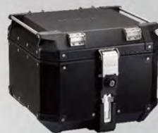
黑色鋁後箱42L | NT$.16,000