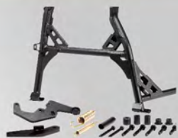
中柱 | NT$.11,000