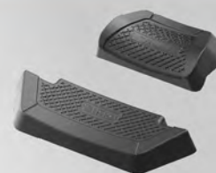
鋁後箱靠墊 | NT$.2,500