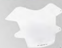
頭燈護罩 | NT$.4,100