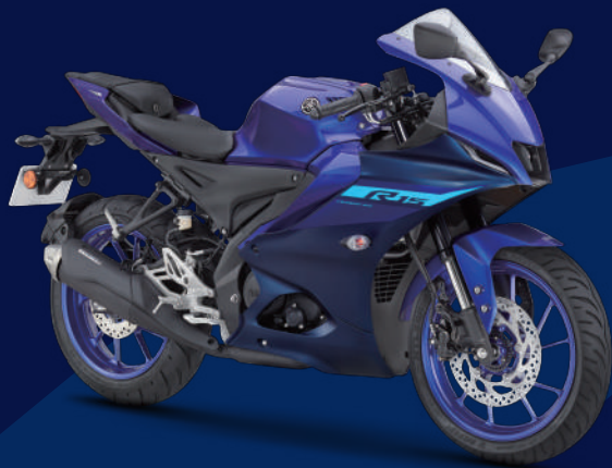
Racing Blue 藍深灰(消光) I73BQ3