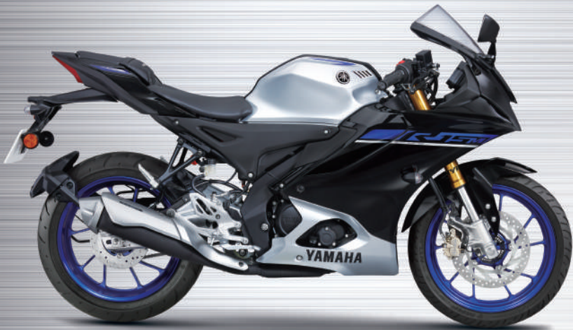
Metallic Grey 銀黑 I83073