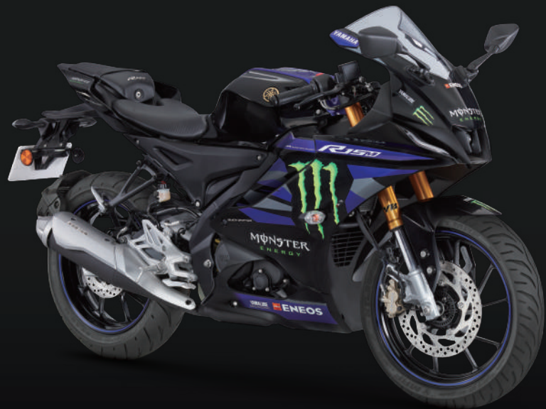
Monster Energy Yamaha MotoGP Edition 黑藍 I83DJ4