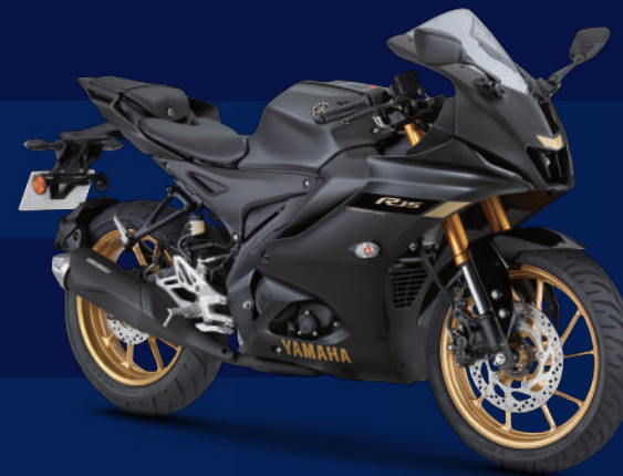
Dark Knight 黑(消光) I73061