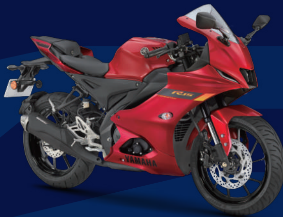
Metallic Red 紅深灰 I73923