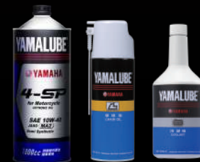
4-SP 鏈條油 冷卻液